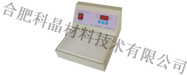
图 3 加热平台图片