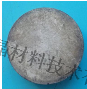
图 1 样品图片

锆钛酸铅压电陶瓷 (PZT): 饼状; 尺寸: \phi 50 \times 10 mm