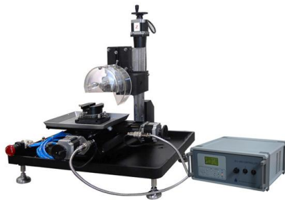
图 2 SYJ-400 划片切割机

SYJ-400 CNC 划片切割机是一款经过 CE 认证的切割机, 它主要适用于各种晶体、陶瓷、玻璃、矿石、金属等材料的划片和切割。本机体积小, 无需大面积空间摆放。可用计算机(附带 MTI 操作软件)或单片机进行控制, 允许自行编制程序, 进行切割。步进电机定位精度可达到 0.01 mm, 样品工作台可进行 360^\circ 旋转, 并配有十字夹具 ( 90^\circ 定位模)、真空吸盘, 是实验室及生产单位理想的精密切割设备之一。